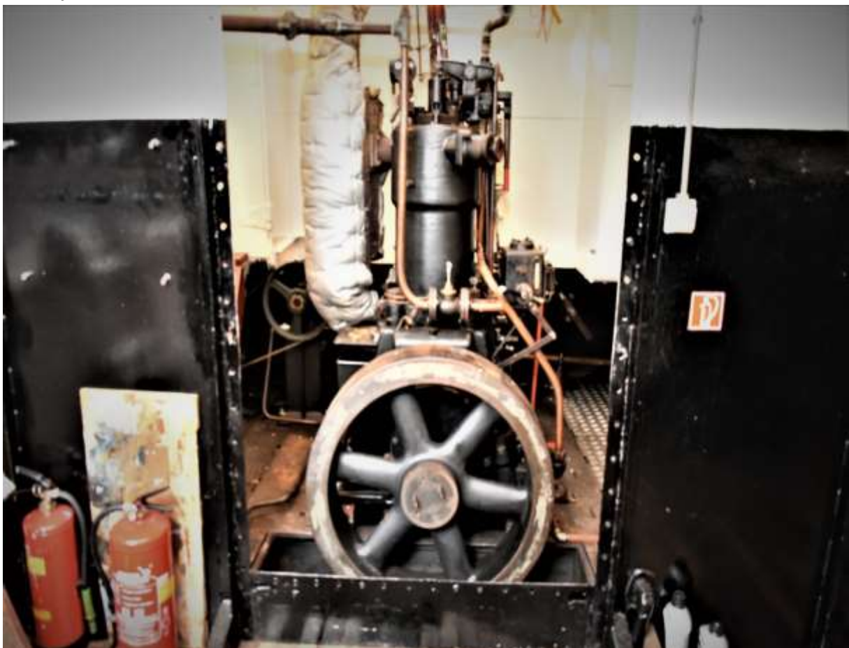
De nieuwe Brons