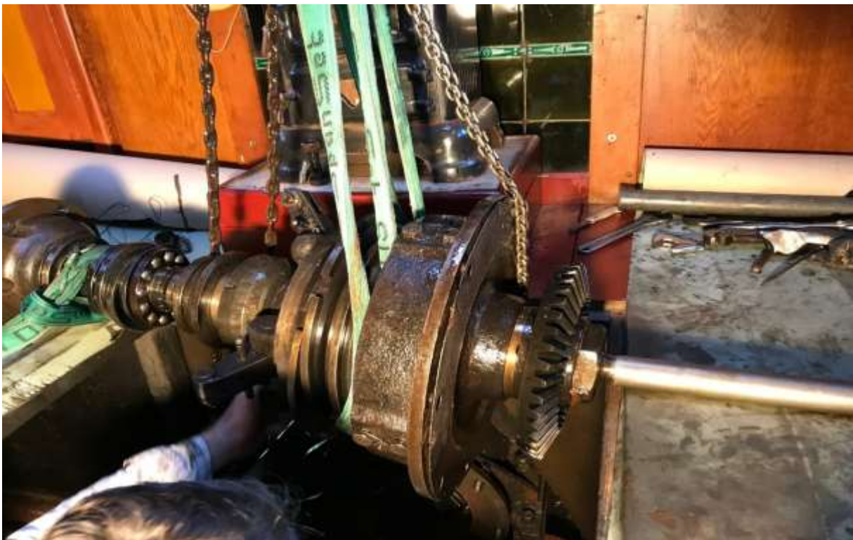
Revisie van de keerkoppeling